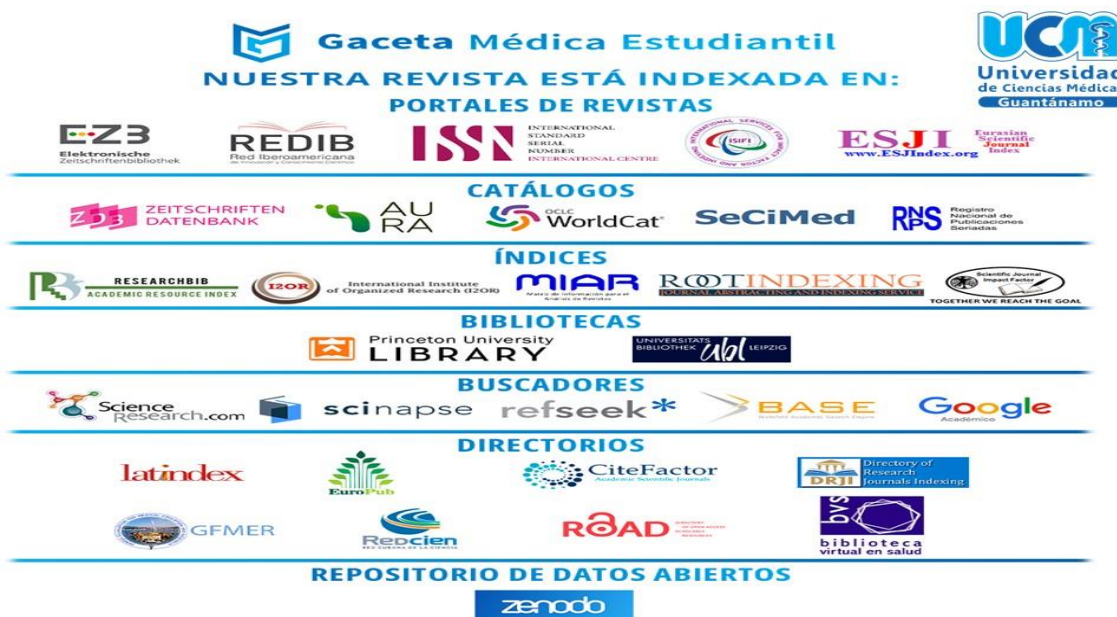
Figura.2 Indexaciones en base de datos de la revista Gaceta Médica Estudiantil en el periodo 2020-2022.

Es notable destacar el mérito que constituye para la revista estar indexada en una de las mayores plataformas de la red Iberoamericana: REDIB y Latindex, la cual le ofrece un marcado acceso abierto ratificado por su última indexación en DOAJ. Tiene una gran importancia para la comunicación, pues de manera didáctica el conocimiento se expande por todo el mundo y viraliza el quehacer de la Universidad de Ciencias Médicas de Guantánamo.